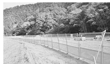
大洞非常口作業ヤード（相模原市緑区）