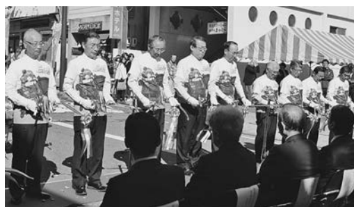
三遠南信しんきんサミット 「丘フェスナミキちゃんTシャツ」姿で テープカット

今回のサミットでは、8信用金庫による共同調査「三遠南信地域に関するアンケート」（以下、本アンケート）を実施し、サミットフォーラムの席上その結果が発表されました。本欄ではその内容を数回にわたって紹介いたします。